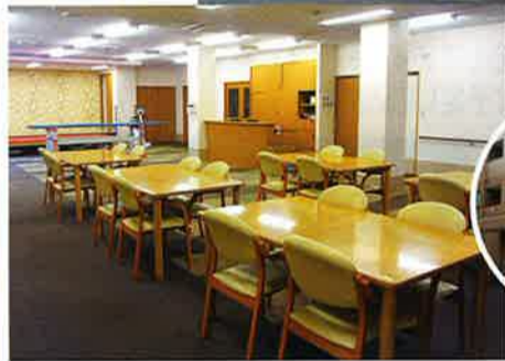
デイ駒川 スタッフ一同

大阪に来られる時は是非一度寄ってみてください、スタッフ一同「駒川オリジナルたこ焼き」を用意しておもてなしさせていただきます!