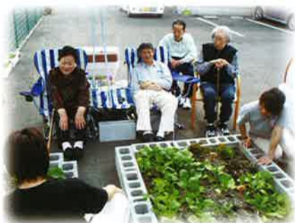
プチ家庭菜園を楽しむ施設も。

地元の人々に愛される昔ながらの商店街。7月の駒川祭りは5万人以上が集まる東住吉区最大のお祭りです。